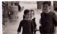
Let's get lost

Libreria Railowsky - Gravador Esteve, 34