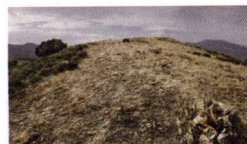
Walter Benjamin: Portbou

Universitat Politècnica de València Edifici Rectorat 3A Camí de Vera, s/n