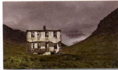
Urbescape. Espais d'hibridació