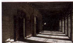
Cartografies silenciades. Espais de repressió franquista