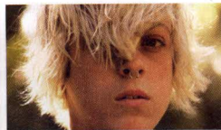
I love us

Institut Français de València - Moro Zeit, 6